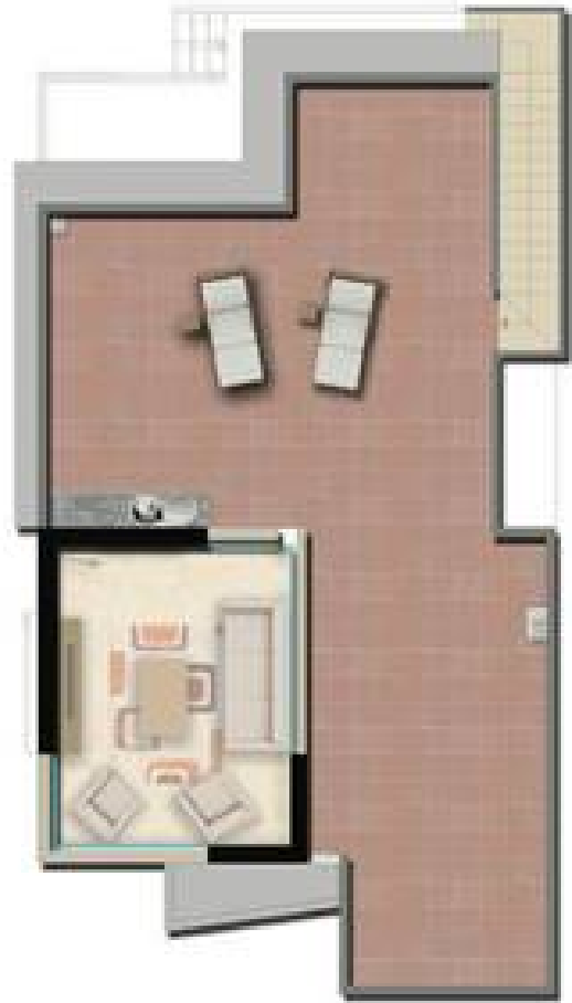
Grundriss ohne Maßstab