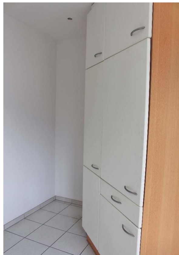
Kochen / Abstellraum