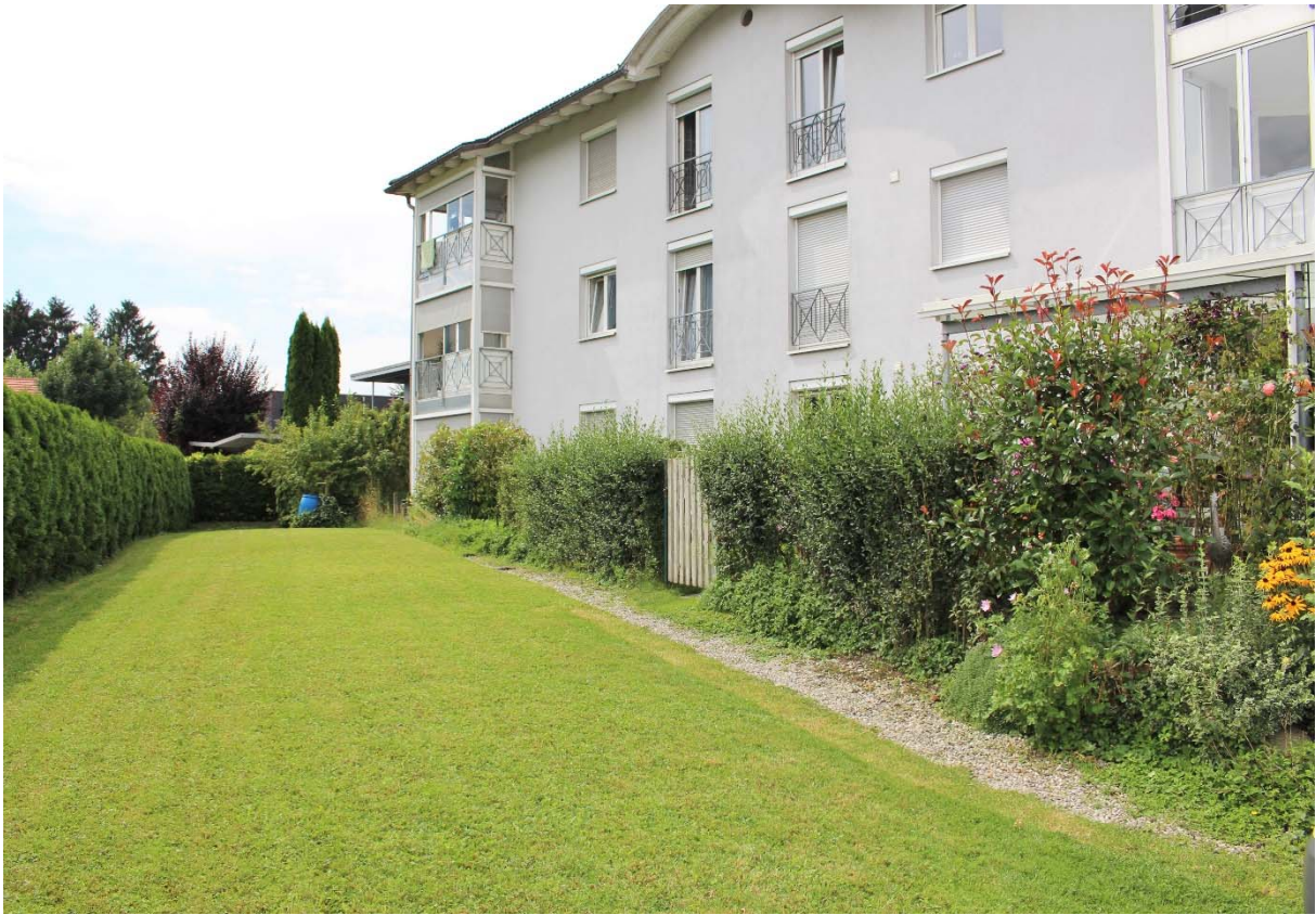
Allgemeinfläche und Gartenanteil