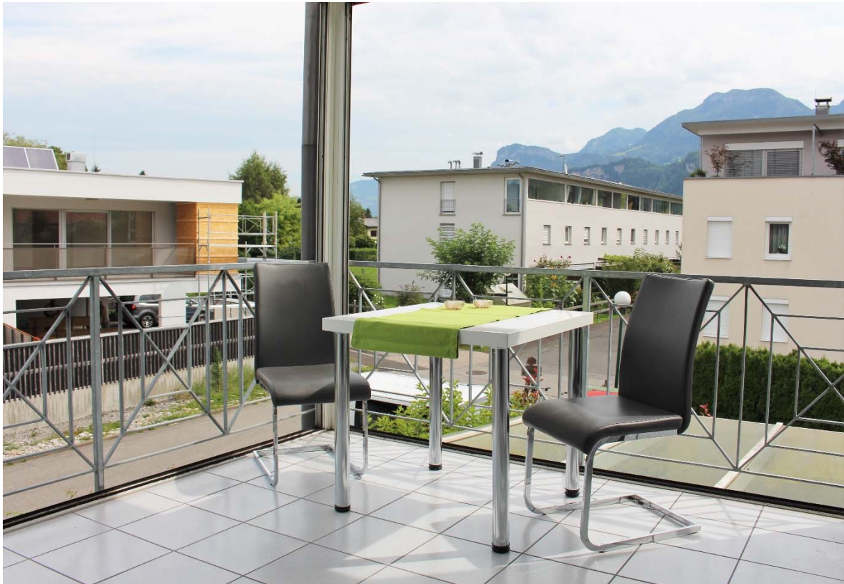
Balkon / Wintergarten