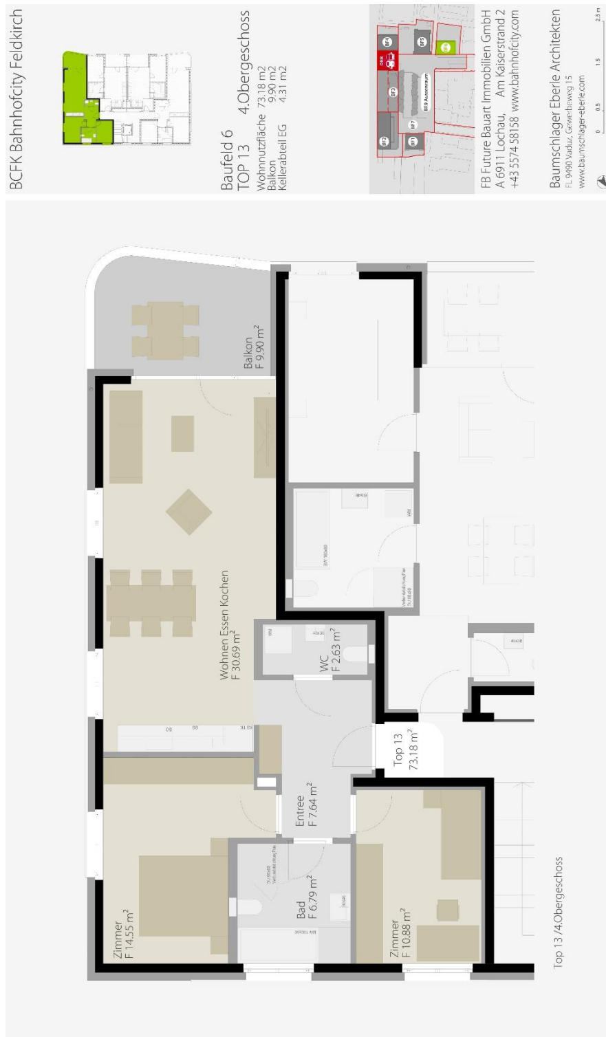
Grundriss mit ca. Maßangaben